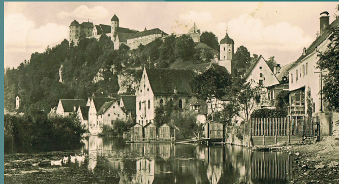
Ansicht von Harburg in Schwaben um 1930, in der Mitte die 1754 erbaute Synagoge.

Führungen kostenlos, Spenden erbeten | Anmeldung bei der Tourist-Information Nördlingen empfohlen